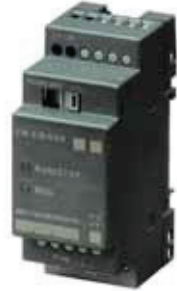
CM KNX (Instabus EIB)