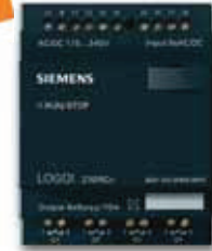
LOGO! 230 RCo