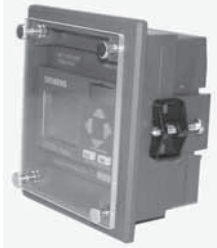
Pano Yüzeyine Montaj Kiti