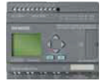
LOGO! 12/24 RCE