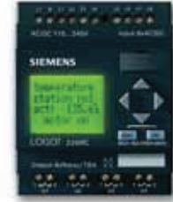
LOGO! 230 RC