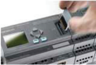
LOGO! 0BA7 SD Kart Slotu