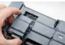
I/O Genişletme Kartı