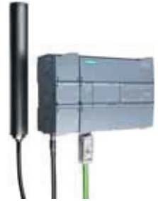
CP1242-7 GSM/GPRS Modem