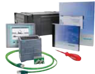
SIMATIC S7-1200 + KTP600 Basic Başlangıç Paketi